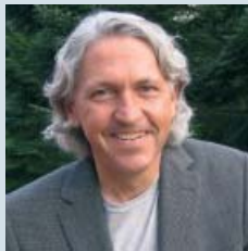
Wirtschaft und Gesellschaft sind im Wandel - immer und überall. Aus journalistischer Sicht sehr spannend.