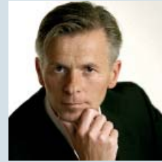
Für mich ist die Zukunft voller Chancen. Deshalb engagiere ich mich für das Land der Ideen.