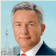
Klaus Wowereit Regierender Bürgermeister von Berlin

Die deutsche Hauptstadtregion gehört heute zu den kreativsten und innovativsten Regionen Europas. Eine schöne Referenz dafür liefert nunmehr bereits im dritten Jahr der bundesweite Wettbewerb „Deutschland – Land der Ideen“. Diese Initiative zeigt auf eindrucksvolle Weise Beispiele von Menschen, die mit Kreativität und Neugier, Ideenreichtum und Tatkraft eine Menge bewegen. In Berlin finden sie dafür hervorragende Bedingungen vor: Allein in diesem Jahr wurden mehr als 40 Berliner Einrichtungen und Unternehmen als Orte im „Land der Ideen“ 2008 ausgewählt.