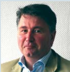
Meine Energie gilt dem Aufbau sog. „Dritter Orte“ als Wirtschaftsmodell einer nachhaltigen Zukunft.

Ich will mehr als nur von Kreativwirtschaft reden. Ich setze mich umsetzungsorientiert ein für die Bedürfnisse und Probleme der Sozialökonomie.